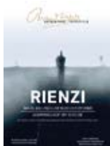
Konzert (ca. 300 Min.) D 2026